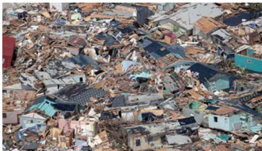
El impacto del fenómeno dejó decenas de muertos, más de 2 000 desaparecidos, inundaciones, derrame de petróleo y poblados enteros barridos.

En medio de ese panorama comenzó el curso escolar, que contó con la ayuda de un