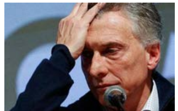
Datos de las encuestas y resultados de su gestión alejan al presidente Mauricio Macri de sus aspiraciones de reelegirse.

En busca de la reelección desde la alianza Juntos por el Cambio, la semana anterior el mandatario anunció su