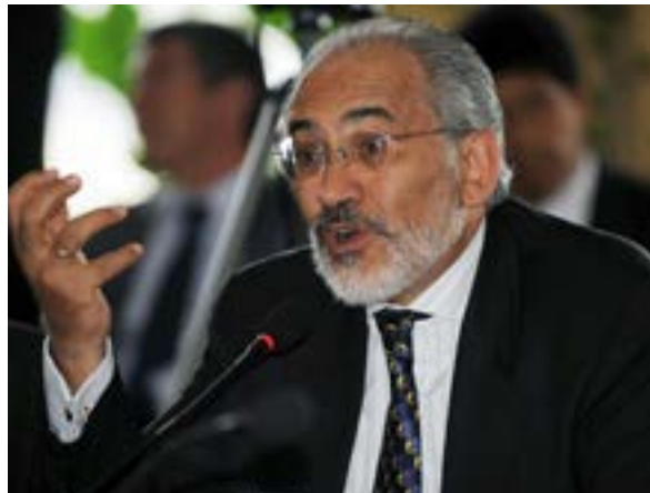
La incongruencia marca el discurso del candidato opositor Carlos Mesa rumbo a los comicios del 20 de octubre.

Elaborado por la encuestadora Viaciencia, el estudio reflejó un crecimiento de la popularidad del candidato del gobernante Movimiento al Socialismo (MAS) en relación con agosto (39,1 por ciento).