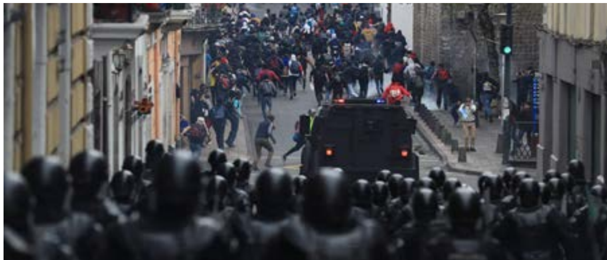
El decreto fue oficializado tras una jornada de paro transportista y de protestas populares contra reformas tributarias y laborales presentadas por el Gobierno.

Por Sinay Céspedes Moreno Corresponsal/Quito