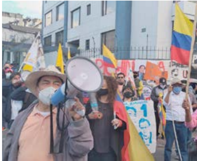
El binomio de UNES gana cada vez más respaldo popular.

Texto y foto: Sinay Céspedes Moreno Corresponsal jefa/Quito