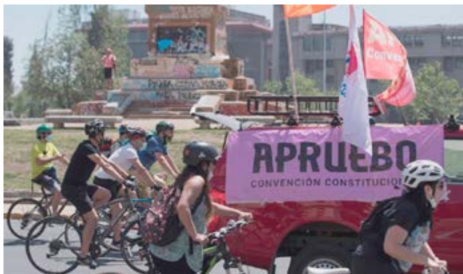
Las encuestas arrojan que el 84 por ciento de los votantes dará su respaldo a una nueva Constitución.