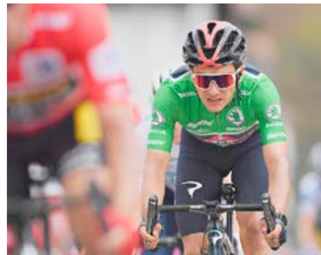
El ecuatoriano compite pletórico de ilusiones.