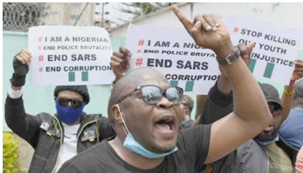
Las protestas violentas dejaron una docena de muertos y numerosas casas, negocios y vehículos destruidos.