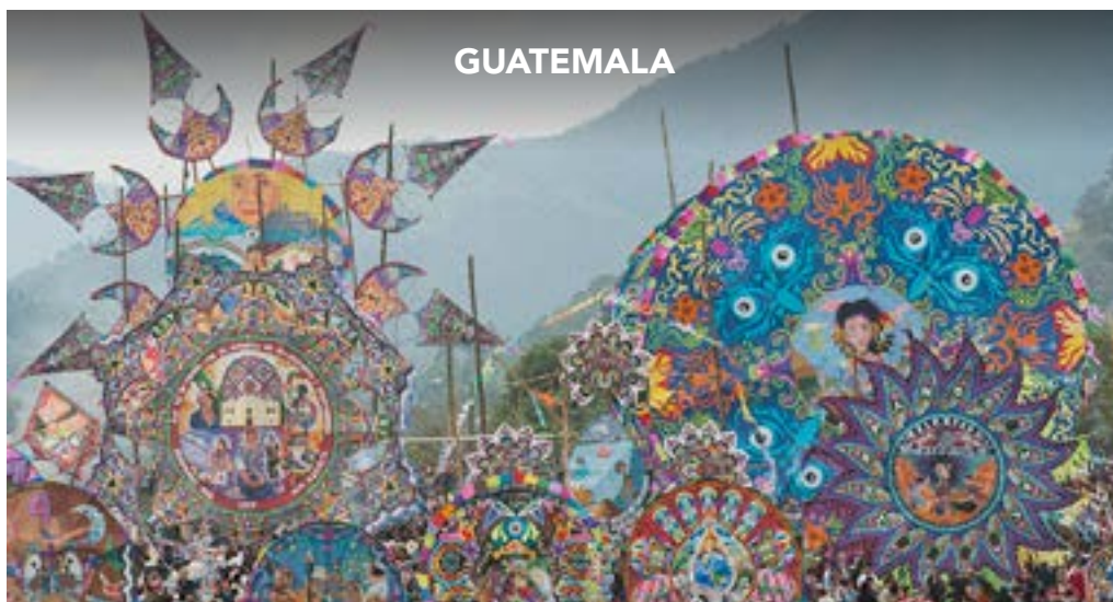
Barriletes gigantes, una tradición única en la nación centroamericana.