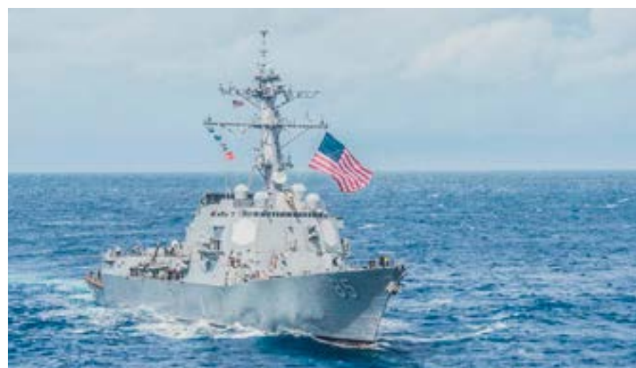
Las autoridades del gigante asiático acusaron a Estados Unidos de poner en riesgo la paz y la estabilidad en el estrecho de Taiwán.

El tema Taiwán es uno de los más sensibles en las relaciones Washington-Beijing y ahora se agitó con la decisión del presidente estadounidense, Donald Trump, de buscar el visto bueno del Congreso a la venta de equipos, vehículos y armamentos de avanzada a esa región.