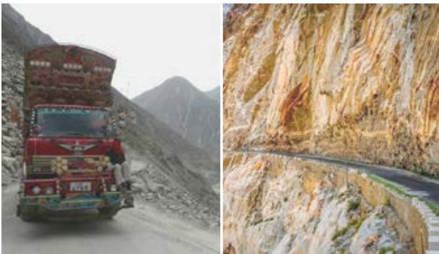
La carretera está catalogada como la más alta del mundo.

Uno de sus tramos comparte recorrido con la antigua Ruta de la Seda, y al mismo tiempo atraviesa la región de Cachemira, lo cual supone un gran valor estratégico y militar. Esta impresionante obra arquitectónica, que costó numerosas vidas de trabajadores, sobre todo por las caídas y los deslizamientos de tierra, pasa por regiones donde viven singulares grupos étnicos y religiosos, desde los punyabíes del centro de Pakistán, hasta los ismailíes