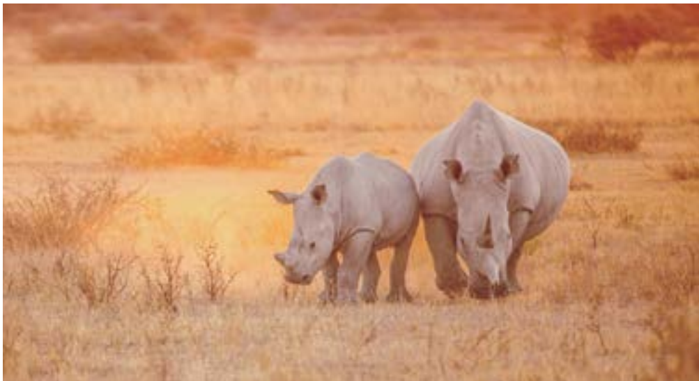
El cambio climático representa un enorme desafío para esta especie.

Además, nuevas plantas invasoras, favorecidas por el aumento de las temperaturas, reemplazaron el forraje favorito de esta especie, cuyos ejemplares ahora vagan por las calles como atracción turística, y junto a ello hay casos de animales electrocutados o envenenados por los agricultores, que temen la pérdida de sus cosechas.