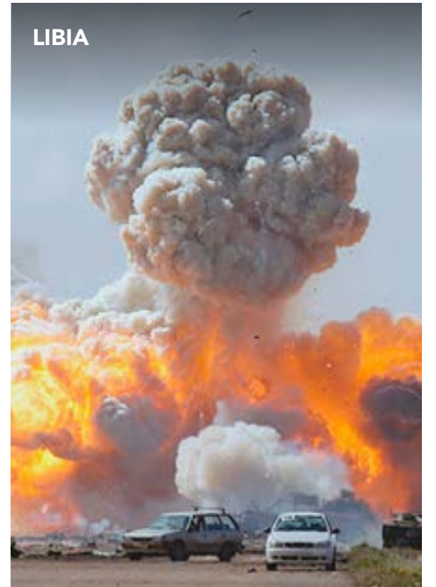
La nación norafricana vive en medio de una guerra civil y la ingobernabilidad.