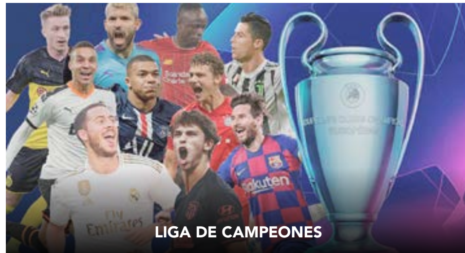
Regresan los días mágicos del fútbol.