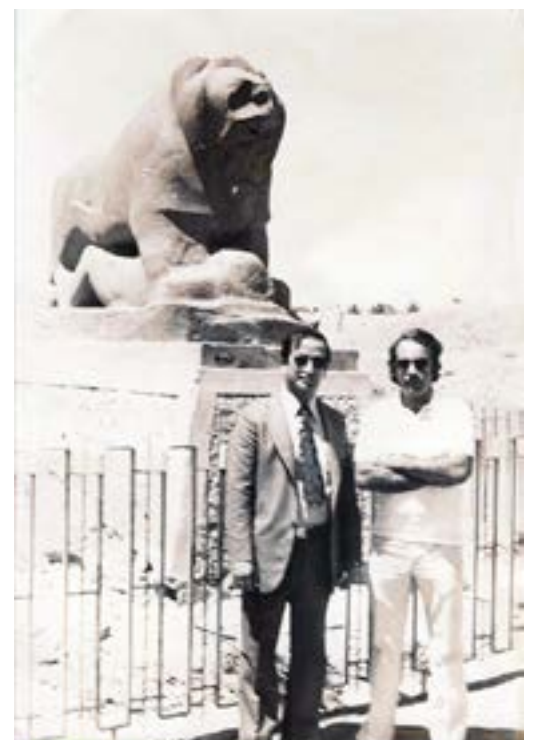
Recuerdo del autor (derecha) al pie del León de Babilonia, década de los 80.

Una armonía superior a la existente en Atenas, con cuya conquista soñaba el estratega cuando se lanzó a dominar Asia, empresa que en su época lo convirtió en un dios viviente, pero durante la cual murió de unas prosaicas fiebres.