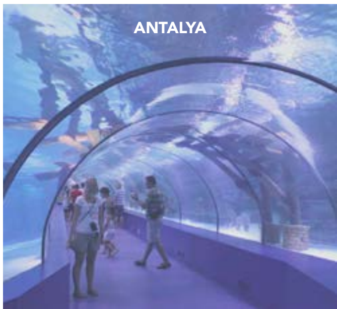
El acuario tiene 40 tanques temáticos, un corredor de 131 metros de largo y tres de ancho.

Algunos petroglifos datan de entre los años 5000 y 1000 a. n. e., mostrando imágenes de seres humanos y escenas de caza con animales más grandes que los cazadores. Las figuras quedaron grabadas en la roca con el uso de herramientas de piedra y resultaron cubiertas con una gruesa capa de óxido, mediante la cual se puede calcular su edad.