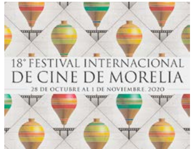
Durante el evento cinematográfico serán exhibidos 90 filmes.

Además, por séptimo año consecutivo, el evento acogerá la Selección de Cortometraje mexicano en línea, donde compiten 40 títulos por el premio del público y estará dis-