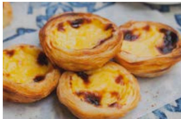
En todo el planeta solo tres personas conocen actualmente cómo preparar esos típicos dulces.

Toca ir hasta las proximidades del Monasterio de los Jerónimos, en las orillas del río Tajo, para deleitar el paladar con el auténtico sabor de ese manjar, que se ha convertido en símbolo de Lisboa y de Portugal.