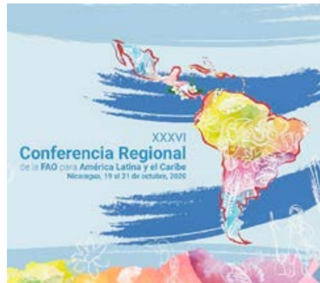
En el año 2050 la demanda mundial de alimentos crecerá en un 50 por ciento.

Después de esta Conferencia todo el mundo recordará a Nicaragua, dijo Qu Dongyu antes de prometer una visita y expresar los deseos de comer su plato favorito, el típico arroz con pescado, en el país de lagos y volcanes.