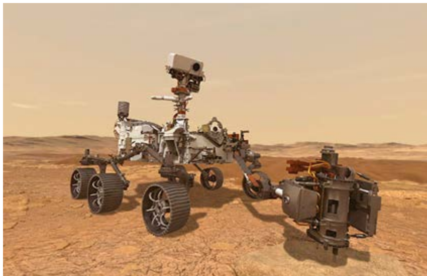
La llegada del vehículo espacial al llamado planeta rojo abre infinitas ventanas a la investigación científica.

Todavía hay mucho que hacer en la Tierra antes de refugiarnos en Marte.