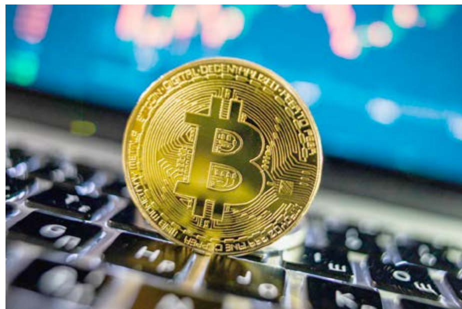
La criptomoneda sube y baja como las olas.

Refieren los investigadores que la minería de bitcoin utiliza 121,36 teravatios por hora de electricidad, todo un récord al año, causante de un fuerte impacto ambiental.