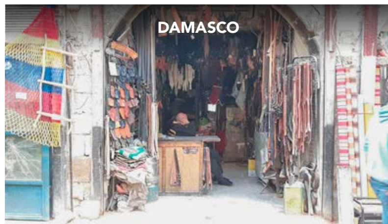
Los vetustos mercados de la ciudad comienzan a sacudirse el polvo del terrorismo.