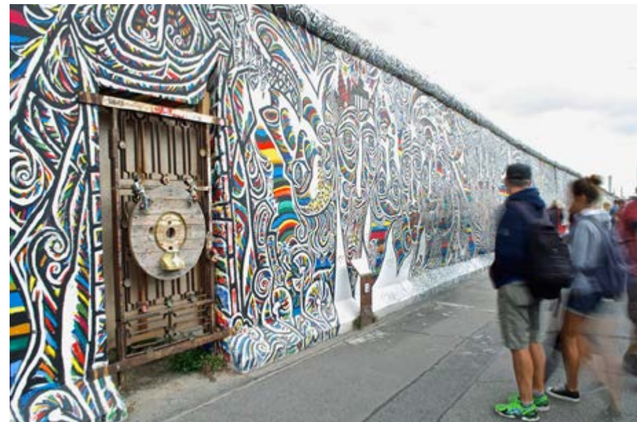
El arte callejero es una expresión frecuente en el país europeo.

Igualmente, descuellan las puestas en escena de Dr. Bergs Ferndiagnosen y Habibi Keks Radioshow , obras que también se encuentran disponibles en Internet, en tanto el Museo Regional de Brandeburgo tomó por asalto siete exhibidores con la muestra pictórica titulada El arte recorre los espacios .