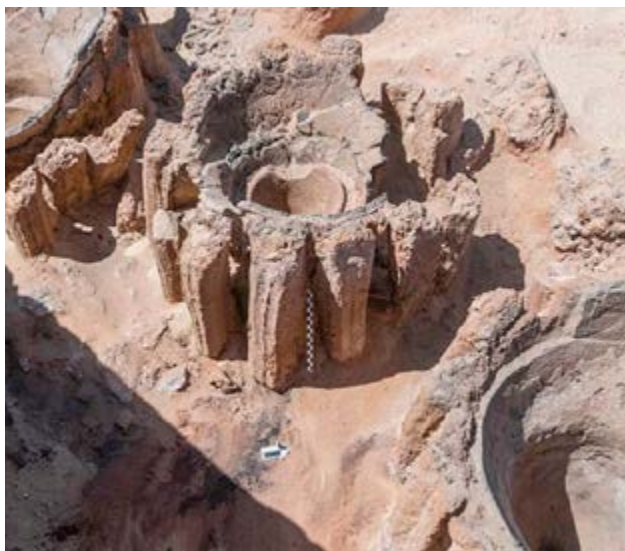
La fábrica de la bebida fue encontrada en el cementerio de Abydos.

faraón, llamado Narmer o Menes—, una misión egipcio-estadounidense arrojó pistas sobre una instalación dedicada a la producción de cerveza, hace 5 100 años.