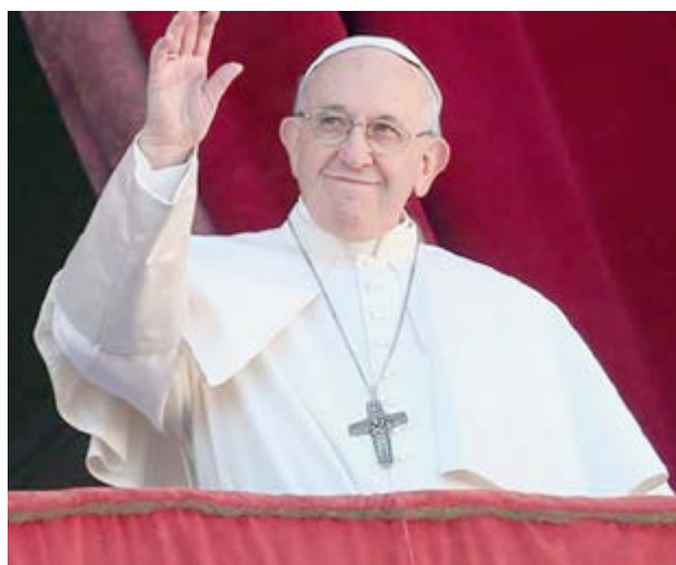
La visita del sumo pontífice a la nación árabe incluirá a Bagdad, la capital, y otras cuatro ciudades.

La comunidad minoritaria de seguidores, estimada en unos cientos de miles, fue blanco de la agrupación extremista, que de 2014 a 2017 ocupó grandes áreas y ciudades importantes de la nación árabe.