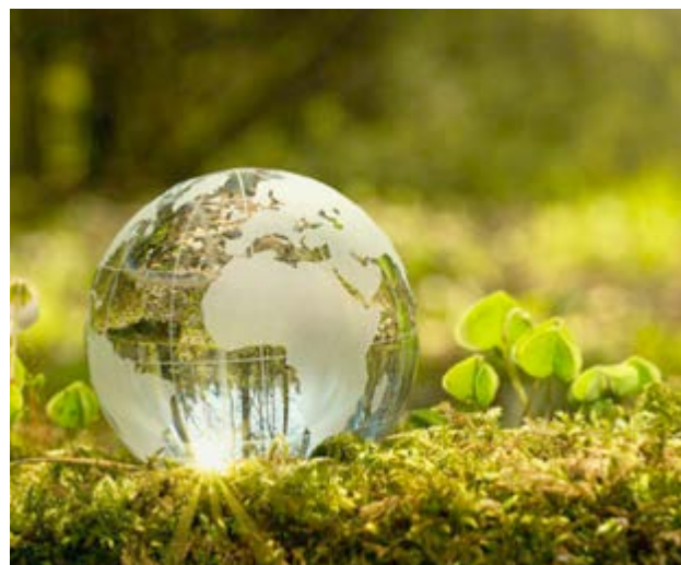
La batalla es por lograr ecosistemas y vidas más sanas en el planeta.

Debemos actuar unidos antes de que lleguemos al punto de no retorno para resolver lo que denominan triple crisis planetaria: la pérdida de biodiversidad, el cambio climático y la contaminación, reflexiona.