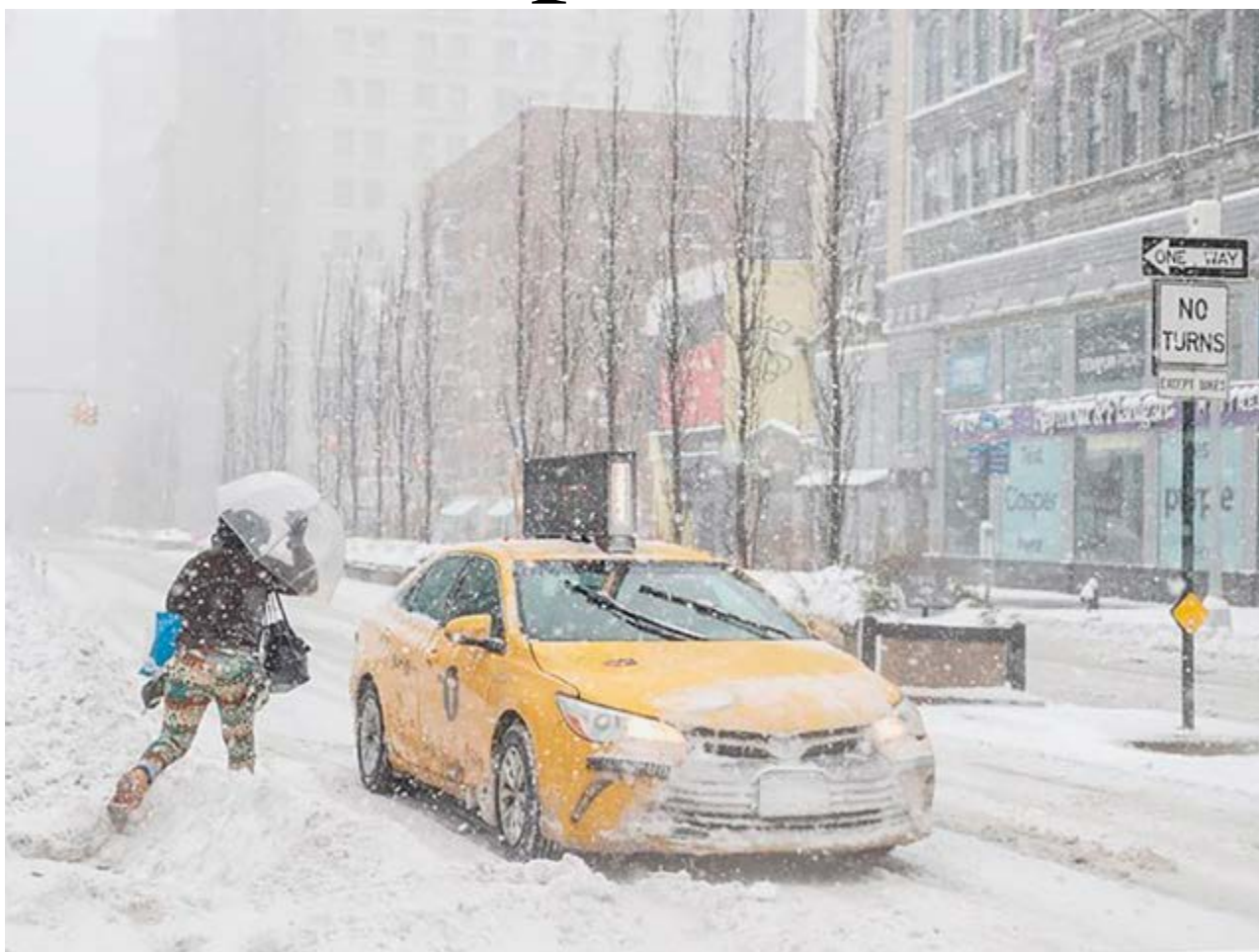
El frío intenso provocó la muerte de decenas de personas.

Esa tragedia ya forma parte de una serie que Abbott enfrentó en sus seis años como gobernador: el huracán