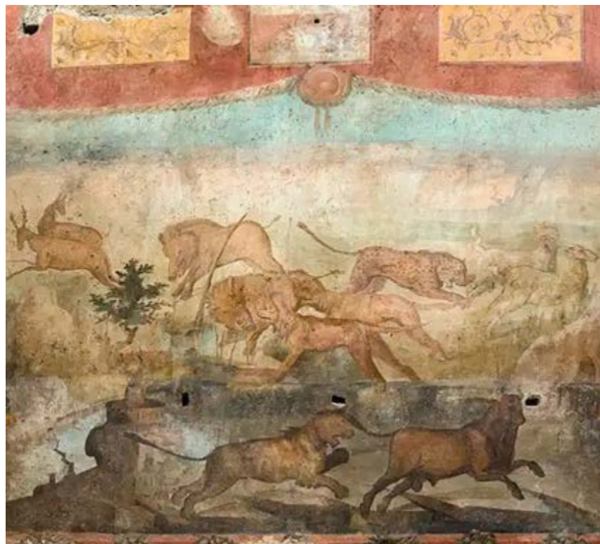
El cuadro adorna una pared trasera en la casa pompeyana.

En los años recientes, la domus fue objeto de intervenciones de remodelación, mantenimiento de las cubiertas y regulación de aguas pluviales, como parte del proyecto Gran Pompeya.