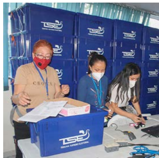
Los comicios legislativos y municipales redibujan el escenario hasta el final del mandato del presidente Nayib Bukele.

De momento, el sentido común invita a ejercer un sufragio responsable y razonado. Sin embargo, a juzgar por la historia, el escepticismo y el desencanto podrían conjurarse para un nuevo —y habitual— triunfo del abstencionismo.