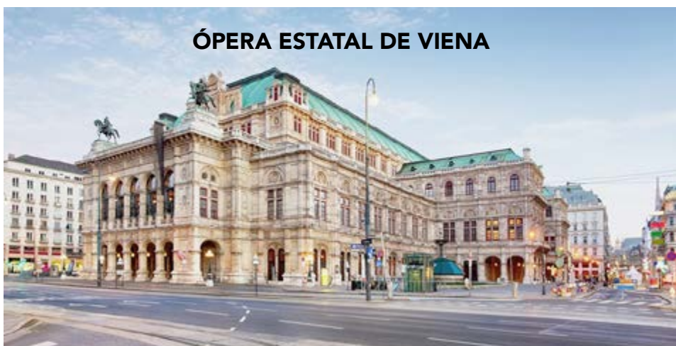
La institución tuvo que modificar su oferta cultural debido a la pandemia de la Covid-19.