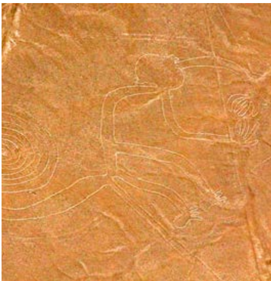
Se dice que los dibujos son como señales que servirían para orientar a los peregrinos.

Al respecto, existen teorías deductivas lógicas —como la dirección coincidente de las rayas, que apuntan a un templo nasca, y por ello serían señales de orientación a peregrinos—, e incluso una especulación sostiene que, como se aprecian en su totalidad a considerable altura, constituyen parte de un aeródromo para naves espaciales extraterrestres.