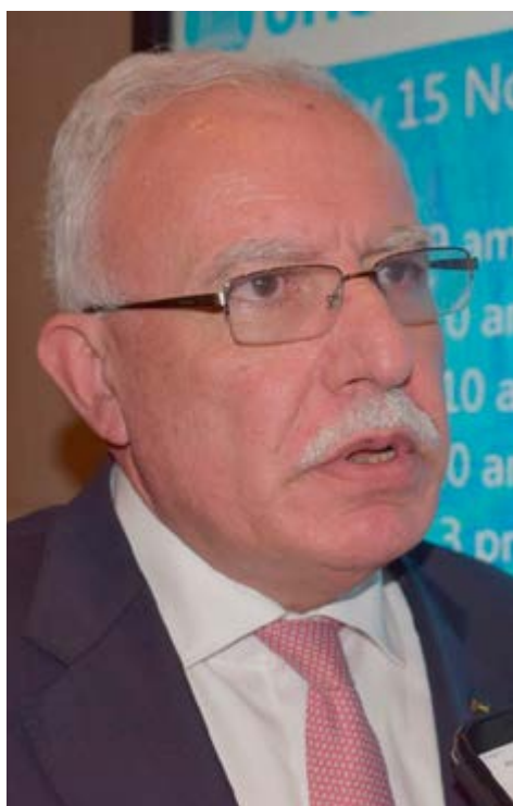
El canciller palestino, Riyad al-Malki, intervino en el segmento de alto nivel.

Ese es uno de los pocos mecanismos que protegen al pueblo palestino y es vital para garantizar sus derechos humanos, por lo cual, quienes buscan eliminar el tema siete apoyan los crímenes que ha cometido Israel durante 54 años, denunció Al-Malki.