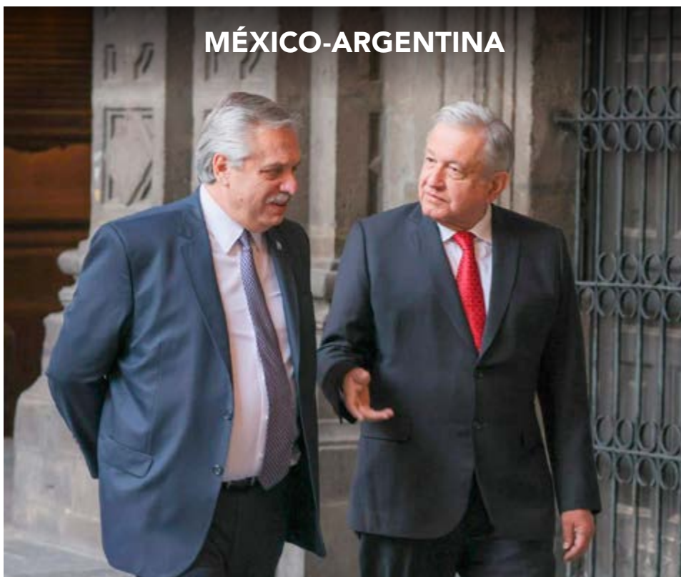
Los presidentes Alberto Fernández (izquierda) y Andrés Manuel López Obrador.