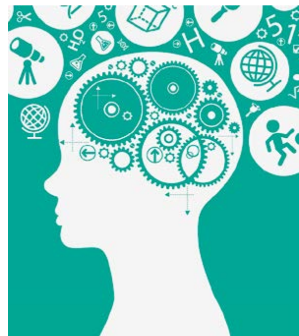
Para algunos expertos esta técnica es utilizada con resultados positivos en el campo del marketing y la crianza de los niños.