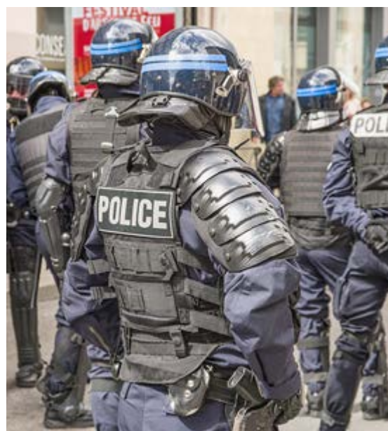
La mayoría de los ciudadanos expresa una falta de confianza en las fuerzas de seguridad.

Con esta mesa de diálogo, que previó Macron en diciembre último e iniciada el 25 de enero, se pretende, además, “sacar a la policía de la crisis por la que atraviesa desde hace tiempo, ya que los casos de violencia policial alcanzaron un pico en 2020”, un hecho que el propio Gobierno reconoce.