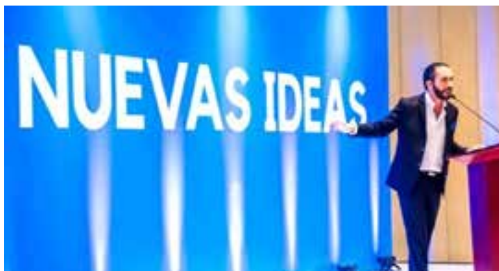
Con el control de la Asamblea Legislativa por Nuevas Ideas, quedará Bukele sin la excusa propicia para incumplir sus promesas de campaña.

Por Charly Morales Valido Corresponsal/San Salvador