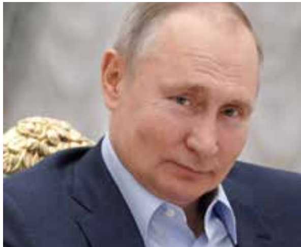
La acusación de "asesino" de Biden (debajo) a Putin, pone en un callejón sin salida los maltrechos vínculos bilaterales.