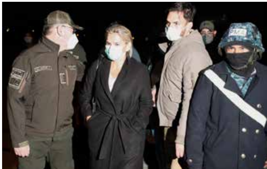
Jeanine Áñez, acusada de sedición, terrorismo, conspiración y violaciones de derechos humanos, cuenta con la OEA y su secretario general, Luis Almagro, copartícipes del golpe de Estado.

Mientras, hay todo un espectáculo mediático alrededor de la figura de Áñez, que se empeña en pasar por víctima para evitar asumir las consecuencias de sus actos.