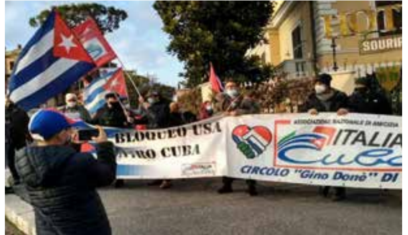
En las más diversas formas --marchas, bicicletadas, caravanas de autos, actos políticos, redes sociales y otras—el mundo expresó su condena al bloqueo del Gobierno estadounidense contra Cuba.