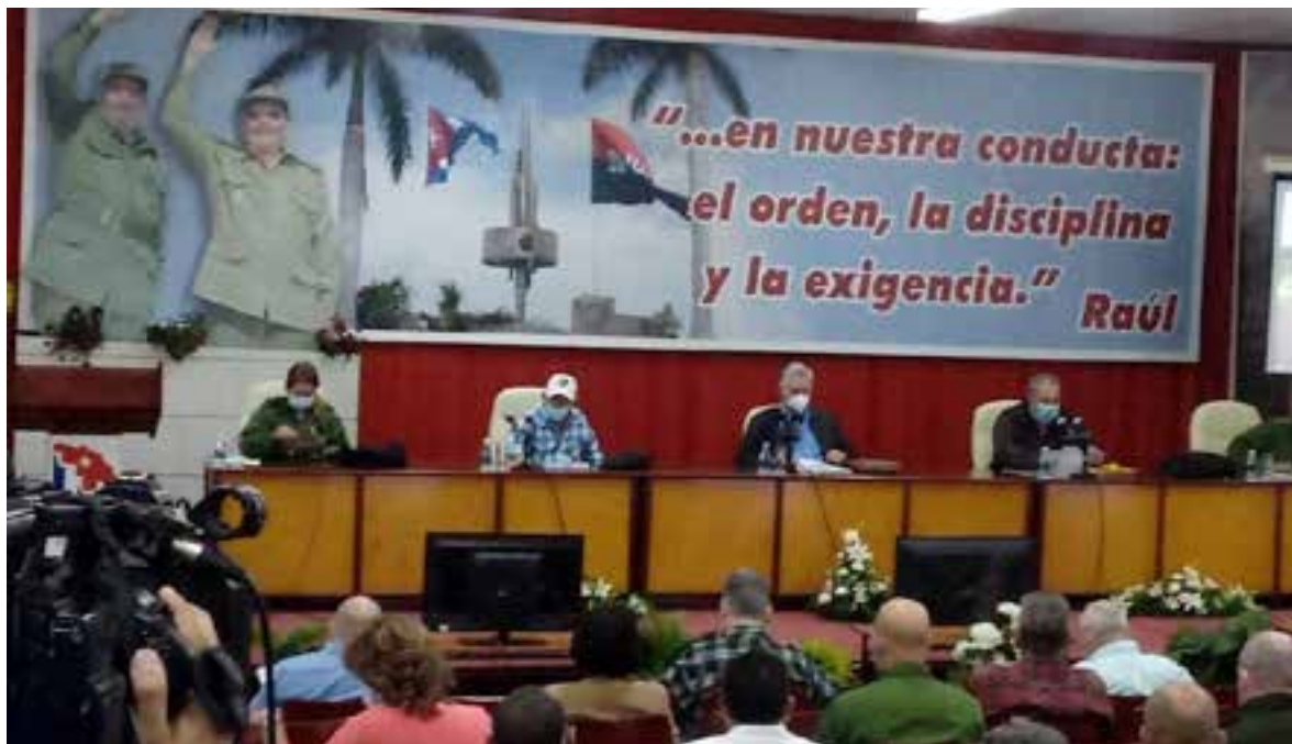
El gobierno cubano no se cruza de brazos, va a cada territorio para analizar los temas más acuciantes, señalando los problemas, a la par que contribuye a buscar alternativas para solucionarlos.