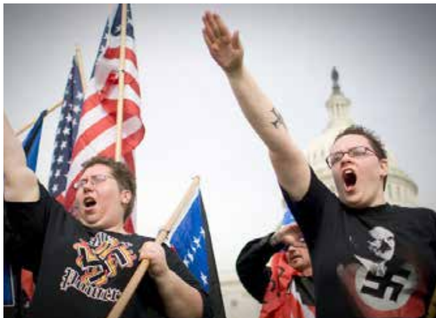
António Guterres subrayó que los supremacistas blancos y los neonazis intensifican sus esfuerzos por negar, distorsionar y reescribir la historia.

En Europa, Estados Unidos y otros lugares, detalló, los adeptos de esos grupos se están organizando y