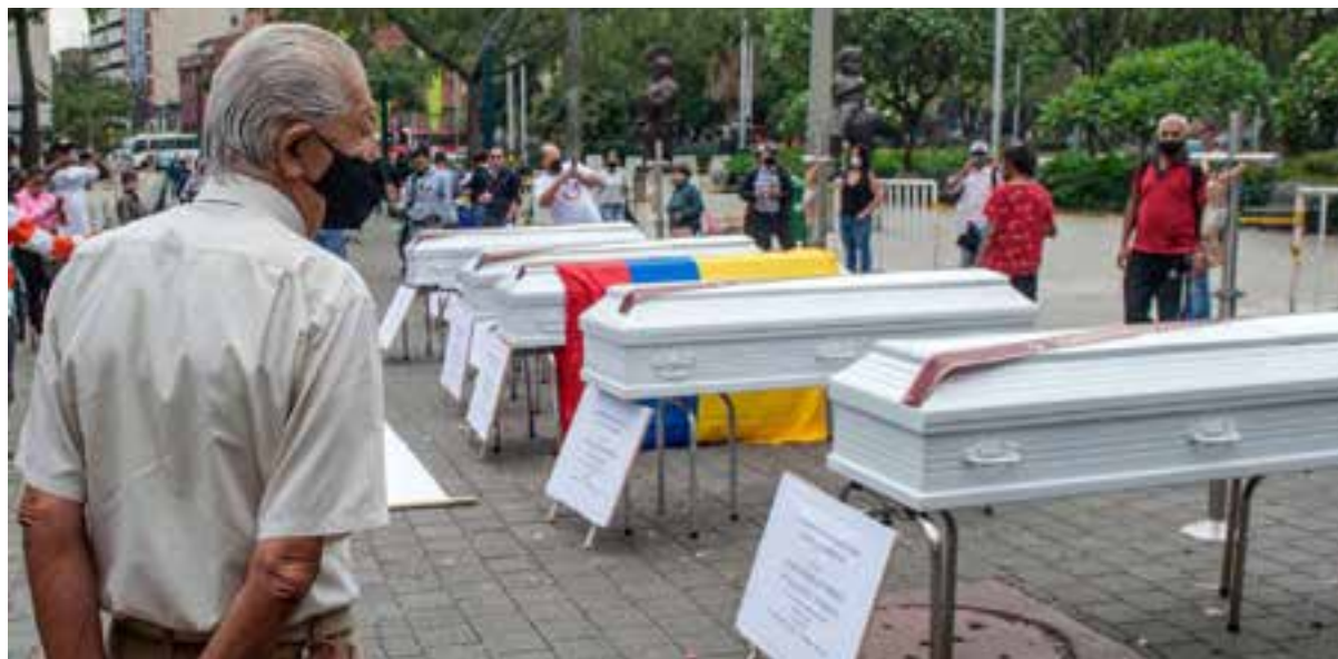
Una masacre cada cuatro días, un líder social muerto cada 41 horas y un exguerrillero asesinado cada cinco días es el saldo que deja la violencia en el país, según un estudio de la Jurisdicción Especial para la Paz.

De momento, la paz parece un sueño para los colombianos, aunque una aspiración posible; voluntad política e iniciativas consensuadas a nivel de sociedad son factores primordiales para transformar ese anhelo en realidad.