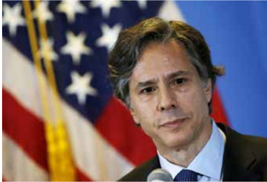
El secretario de Estado, Antony Blinken, al declarar recientemente ante el Senado, se refirió ofensivamente al presidente Nicolás Maduro.

Al respecto, el equipo del mandatario reconsidera las posiciones sobre Irán, y prevé aplicar en parte la política de Barack Obama (2009-2017) sobre el tema. Según fuentes oficiales, la Casa Blanca intenta reiniciar, con condicionantes, las negociaciones con la nación persa en un esfuerzo por volver a cumplir con el Plan Integral de Acción Conjunta (Jcpoa, por sus siglas en inglés), firmado en 2015,