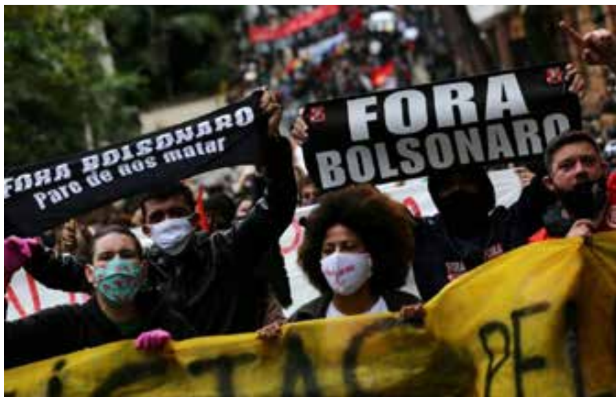
Al masivo reclamo popular, se suma la cifra de solicitudes de destitución del mandatario ultraderechista, que ya supera las 60 en la Cámara de Diputados.

Por Oswaldo Cardoso Corresponsal/Brasilia