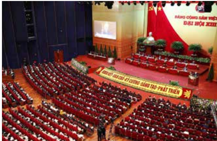
El lema que presidió el XIII Congreso, "Unidad, democracia, disciplina, innovación, desarrollo", marcará el quehacer de Vietnam en los próximos cinco años.

Probablemente el enunciado general del Congreso que más agradó a los vietnamitas fue uno que recogió su Resolución y según el cual el PCV y toda la sociedad seguirán trabajando por convertir a Vietnam en un país próspero, sostenible y de rápido desarrollo. La garantía de que ello ocurrirá fue la reiteración de que la economía de mercado de orientación socialista continuará siendo su modelo de desarrollo. En